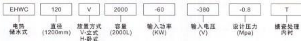
新波能牌 EHWC系列(储水式立式)电热水炉示意图